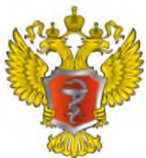
Министерство здравоохранения РФ

Не растерявшись в экстренной ситуации и правильно оказав первую помощь, вы спасете ребенку жизнь!