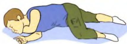
Устойчивое боковое положение